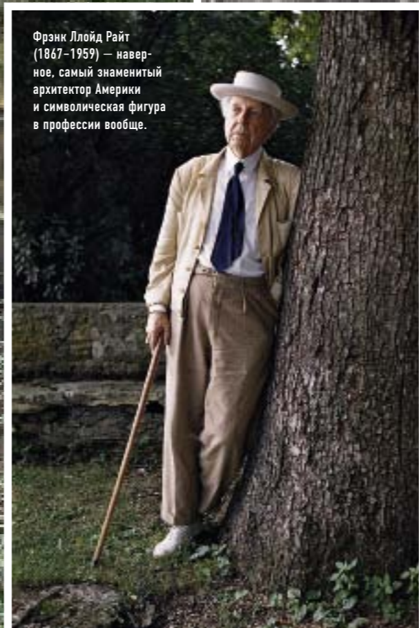
Фрэнк Ллойд Райт (1867–1959) — наверное, самый знаменитый архитектор Америки и символическая фигура в профессии вообще.