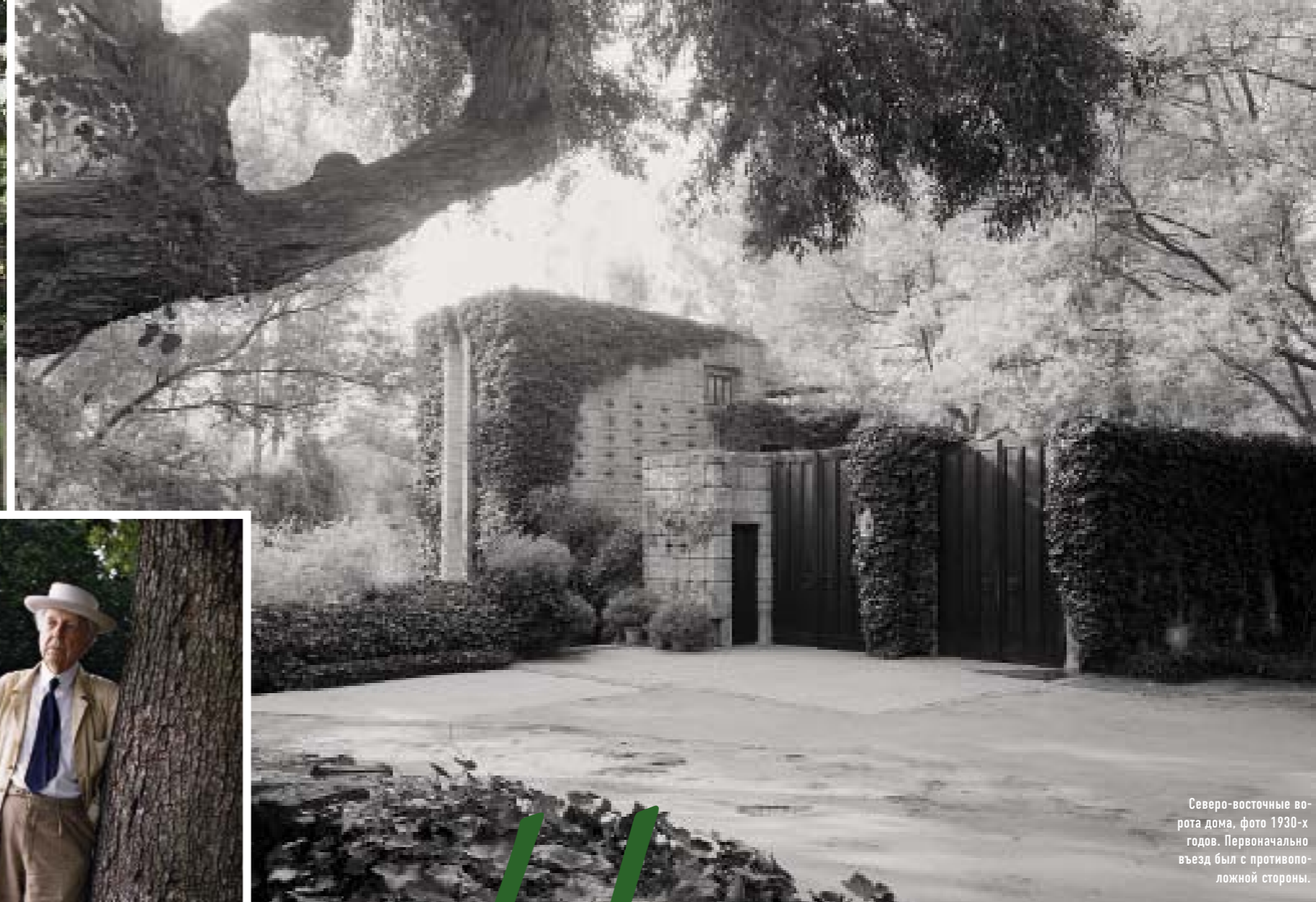
Северо-восточные ворота дома, фото 1930-х годов. Первоначально въезд был с противоположной стороны.