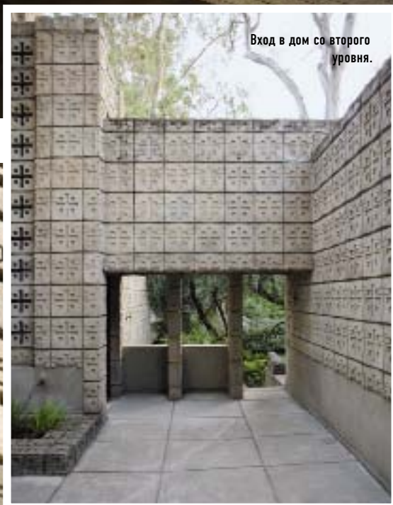
Вход в дом со второго уровня.