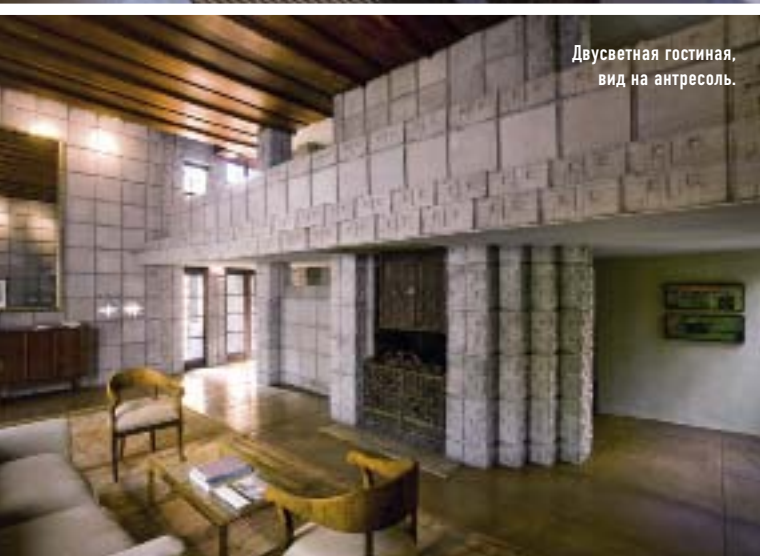
Двухсветная гостиная, вид на антресоль.

> архитектуры, выражающей “дух места” и находящейся в цветовой гармонии со средой, в состав бетона Райт добавлял песок и гравий со строительной площадки. К счастью, в этот раз блоки были изготовлены без металлической арматуры, поэтому хорошо сохранились.