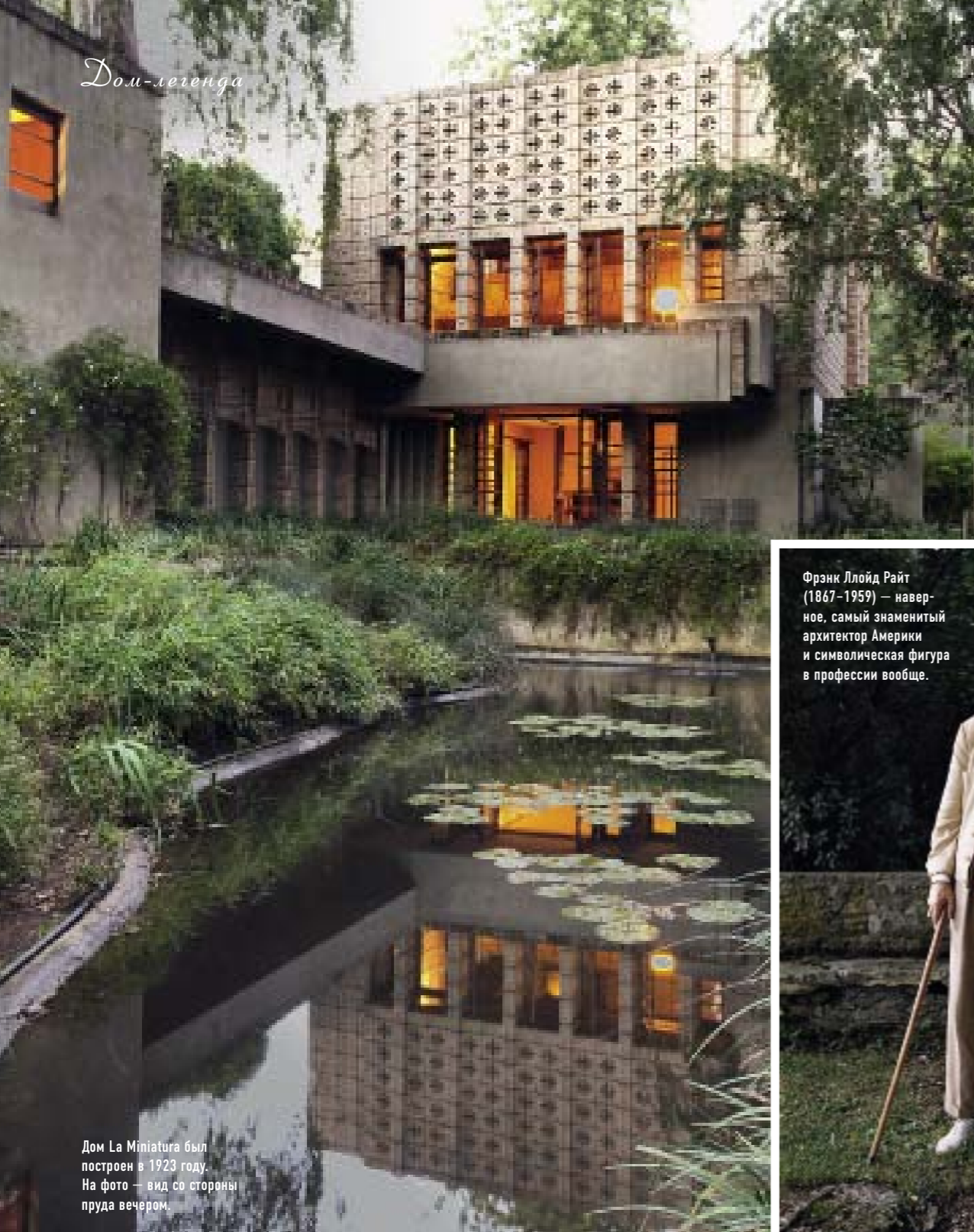
Дом La Miniatura был построен в 1923 году. На фото — вид со стороны пруда вечером.