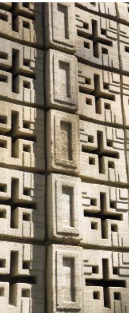
Изобретенные Райтом "текстильные блоки" из бетона эффектно смотрятся, создавая сложную фактуру фасада.

> Фрэнку его детские строительные кубики Froebel Gifts и казались способом удешевить строительство с помощью стандартизации. Железобетонные блоки (примерно 40 × 40 × 20 см) отливались в формы со стилизованным орнаментом. Из них возводились двойные стены с небольшим зазором для тепло- и звукоизоляции. Теоретически для отливки блоков не требовалась квалификация, это мог делать кто угодно за минимальную плату. Сочетание ручного труда со стандартизацией должно было придать дому уникальную фактуру и сделать его финансово доступным для масс. В теории всё было замечательно, на практике возникли проблемы. Блоки, отлитые неумелыми рабочими, часто приходилось переделывать по несколько раз. Арматура внутри блоков начинала ржаветь, и через несколько лет блоки трескались и иногда разваливались.